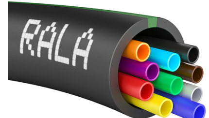
Exempel på 10x7 mm mikrorör i 40x32 mm optorör.