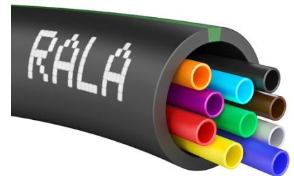
Exempel på 10x7 mm mikrorör i 40x32 mm optorör.