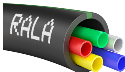
Exempel 5x10 mm mikrorör i 40/32 mm optorör.