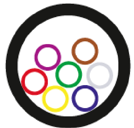
Exempel på 7x7/5,5 mm mikrorör i 40/32 mm optorör.